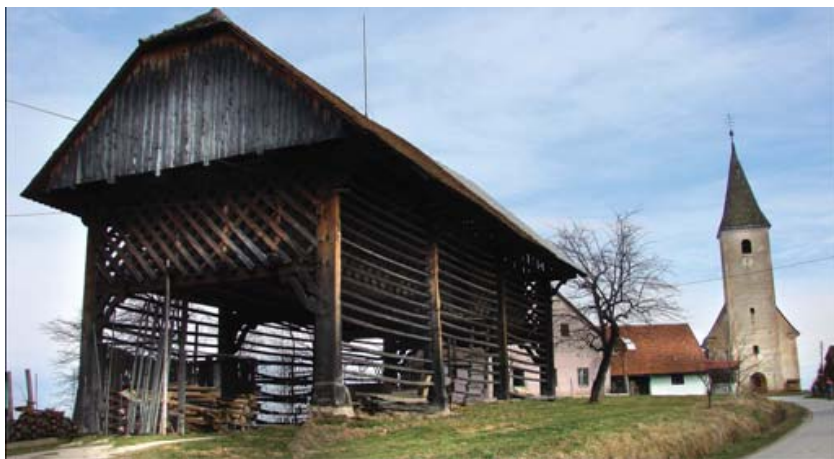
Slika 4: Slamnikov kozolec

Slamnikov kozolec, ki stoji v Kočnem ob Ložnici, je primer kozolca toplarja, ki so v tem delu Slovenije redkejši. Kozolec je grajen v leseni konstrukciji iz hrasta in je pokrit z rdečo opeko in deloma s salonitnimi ploščami. Postavili so ga leta 1884 tesarji iz Šentjurja. Za tesianje in postavitve so potrebovali tri mesece. Odlikujejo ga lepo izvedene lesene mreže. V preteklosti so ga uporabljali za sušenje sena, danes pa služi kot prostor, kjer shranjujejo kmečko orodje in stroje.