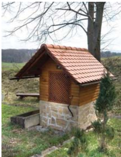
Slika 5: Stari vodnjak

Lesene preše so danes že prava redkost in prav zaradi tega so se vaščani Leviča in Razgorja odločili, da jih restavrirajo in postavijo na vidno mesto. Ob postavitvi, leta 2001 so zraven preš na Razgorju posadili dve lipi. Lepo obnovljene preše so mesto, kjer se vaščani družijo in preživljajo svoj prosti čas. Preša na Razgorju je hkrati domiselna različica avtobusnega postajališča.