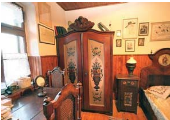
Slika 8: Muzej gledališča

V Leviču je mali muzej gledališča, ki ga je sredi 20. stoletja uredil slovenski gledališki režiser Branko Gombač. Domačija je bila dolga leta zbirališče slovensko-bistriških amaterskih gledališčnikov. Zanimiva je notranjost hiše z razstavljenimi starinami, ki jih je Gombač sistematično zbiral. Hiša ima lepo urejeno fasado in vanjo vzdano fresko sv. Jožefa, delo ljudskega slikarja iz Cigonce.