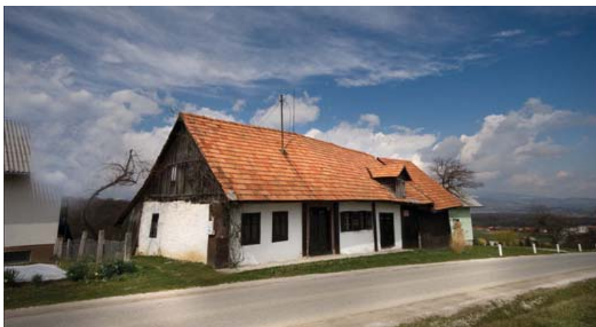
Slika 2: Senegačnikova cimprača

Kulturna dediščina, ki bi lahko bila turistično privlačna, je Senegačnikova cimprača. Stoji ob cesti, ki vodi iz Laporja proti Poljčanam in je ohranila značilno prvotno podobo, kjer so pod eno streho združeni bivalni in gospodarski prostori. Cimpračo so zgradili sredi 19. stoletja. Prvotno je bila streha krita s slamo, kasneje so jo prekrili z opeko. Bivalni prostori imajo značilno razporeditev: ob vstopu v hišo je veža, levo je » velika hiša« in iz nje »štibelc«, desno »hiška« in naravnost »črna kuhinja«. Cimprača je bila še do leta 2007 naseljena.