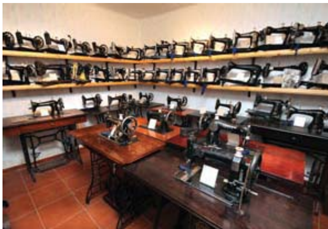
Slika 3: Muzej starih šivalnih strojev

Slamnikov kozolec, ki stoji v Kočnem ob Ložnici, je primer kozolca toplarja, ki so v tem delu Slovenije redkejši. Kozolec je grajen v leseni konstrukciji iz hrasta in je pokrit z rdečo opeko in deloma s salonitnimi ploščami. Postavili so ga leta 1884 tesarji iz Šentjurja. Za tesianje in postavitve so potrebovali tri mesece. Odlikujejo ga lepo izvedene lesene mreže. V preteklosti so ga uporabljali za sušenje sena, danes pa služi kot prostor, kjer shranjujejo kmečko orodje in stroje.