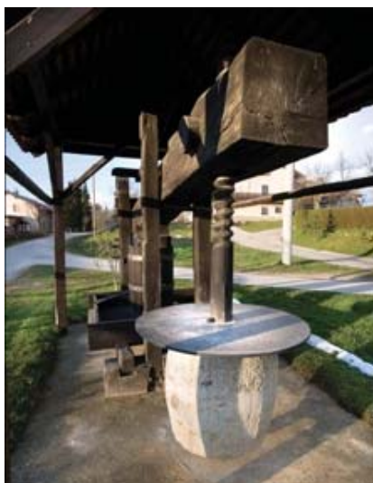
Slika 6: Lesena preša (foto: Brumec B., 2008)

Lesene preše so danes že prava redkost in prav zaradi tega so se vaščani Leviča in Razgorja odločili, da jih restavrirajo in postavijo na vidno mesto. Ob postavitvi, leta 2001 so zraven preš na Razgorju posadili dve lipi. Lepo obnovljene preše so mesto, kjer se vaščani družijo in preživljajo svoj prosti čas. Preša na Razgorju je hkrati domiselna različica avtobusnega postajališča.