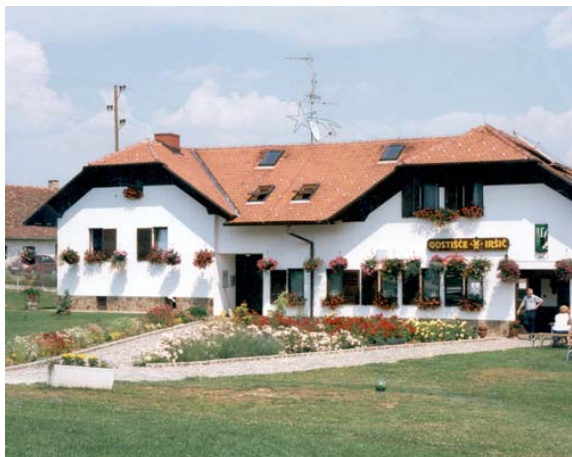
Slika 11: Gostišče Iršič