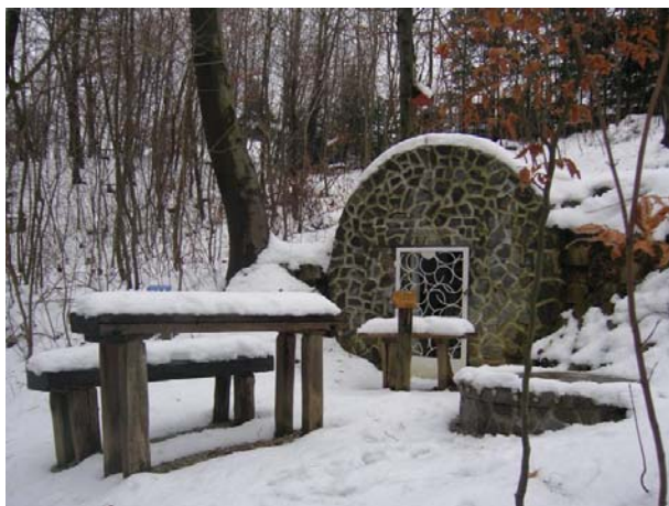
Slika 10: Energetske točke

Odzivi so pohvalni. Mnogo obiskovalcev energetskih točk me pokliče in pove, kako se pri energetskih oziroma zdravilnih točkah sprostijo. Pri energetskih točkah se morejo ljudje odpreti delovanju zdravilnih vibracij.