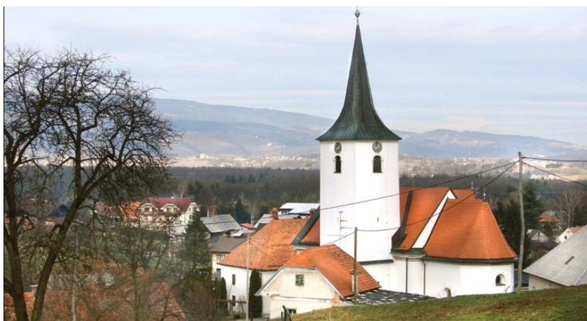
Slika 9: Cerkev Sv. Filipa in Jakoba

Imamo tudi verske oziroma religiozne ustanove. Ena izmed teh je cerkev Sv. Filipa in Jakoba, ki je osrednji kulturni spomenik v kraju. Kot župnija se prvič omenja leta 1395. Na južni strani cerkve je vzidan žrtvenik, posvečen rimskemu bogu Marsu. Tam se odvijajo tudi nekatere kulturne prireditve kot so Poletje v Laporju, Oktober je dober ... Blizu cerkve imamo tudi Slomškov dom, v katerem potekajo ure verouka. Zraven imamo še majhno kapelo.