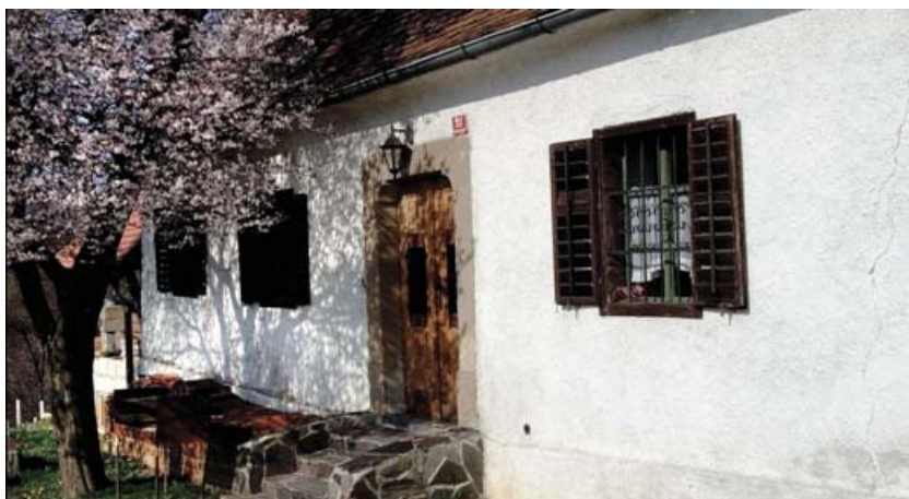
Slika 7: Kavklerjeva zidanica

Kavklerjeva zidanica, ki so jo zgradili sredi 19. stoletja, stoji v Vrholah pri Laporju. V času Malih Borštnikovih srečanj so v njej uredili spominsko sobo, posvečeno Josipu Vidmarju, znanemu slovenskemu publicistu in pisatelju. Svečana otvoritev Vidmarjeve sobe je bila leta 1987. Postala je nekakšno shajališče kulturnih delavcev. Leto pred otvoritvijo je v Kavklerjevi zidanici potekal pomemben simpozij o sodobni slovenski drami.