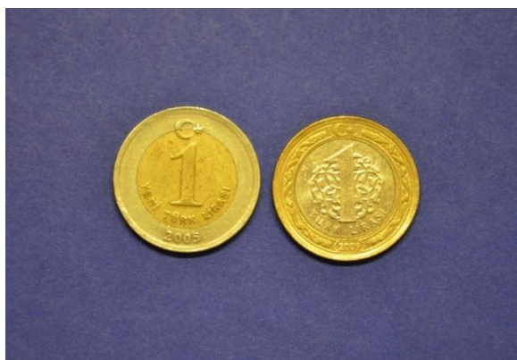
Fotografija 76 Turčija – sprednja stran