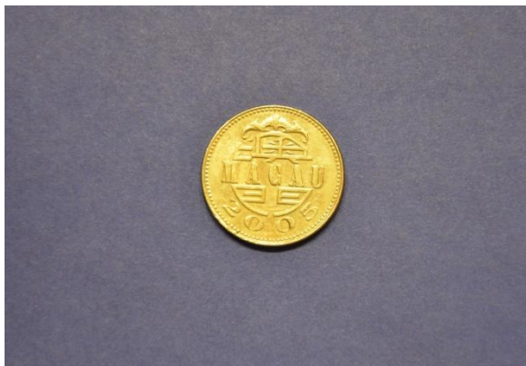
Fotografija 118 Macao – sprednja stran