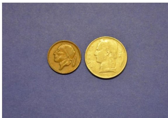
Fotografija 101 Belgija – zadnja stran

50 centim Država: Belgija Leto izdaje: 1972 Material: bron Teža: 2,75 g Premer: 19 mm 5 frankov Država: Švica Leto izdaje: 1963 Material: Cu, Ni Teža: 6 g Premer: 24 mm