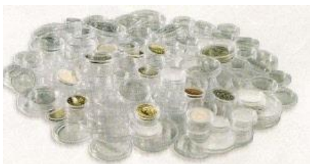
Fotografija 3 Kapsule za kovance