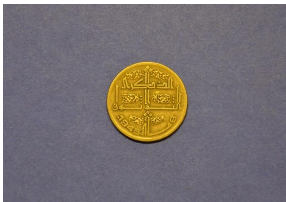
Fotografija 113 Alžirija – zadnja stran

50 sentim Država: Alžirija Leto izdaje: 1975 Material: Al, bron Teža: 5 g Premer: 24 mm