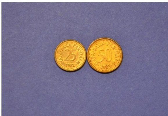
Fotografija 18 SFRJ – sprednja stran