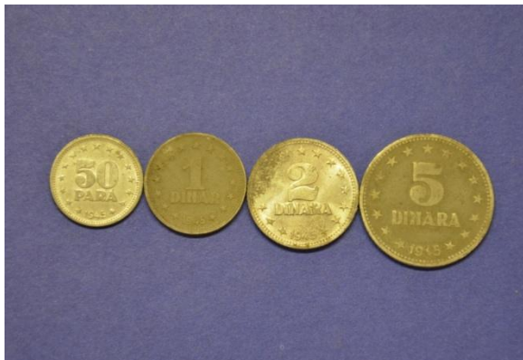
Fotografija 6 Demokratična federativna Jugoslavija – sprednja stran