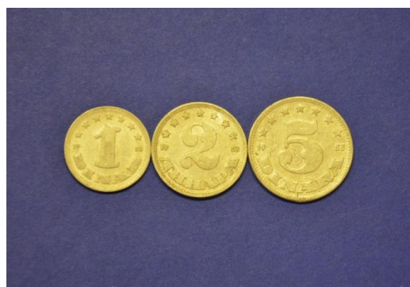
Fotografija 10 Federativna ljudska rep. Jugoslavija – sprednja stran