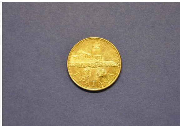
Fotografija 119 Macao – zadnja stran

1 pataca Država: Macao Leto izdaje: 2005 Material: Cu, Ni Teža: 9,1799 g Premer: 25,98 mm