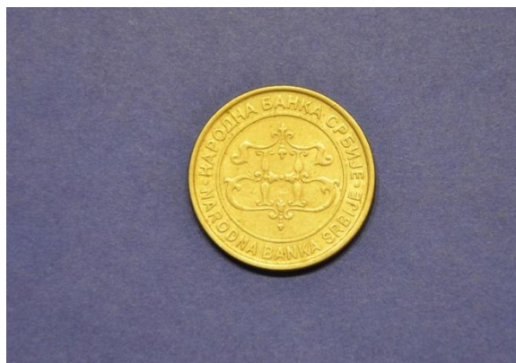
Fotografija 109 Srbija – zadnja stran

20 dinarjev Država: Srbija Leto izdaje: 2003 Material: Cu, Ni, Zn Teža: 9 g Premer: 28 mm