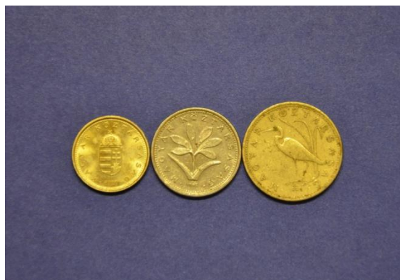
Fotografija 59 Madžarska – zadnja stran