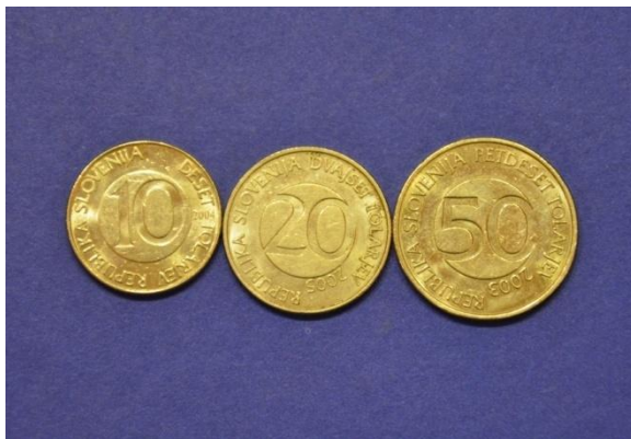
Fotografija 30 Republika Slovenija – sprednja stran