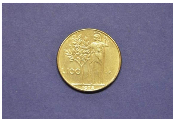
Fotografija 46 Italija – sprednja stran