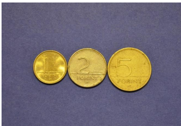
Fotografija 58 Madžarska – sprednja stran