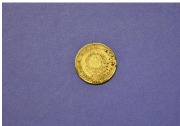
Fotografija 13 SFRJ – zadnja stran

1 dinar Država: SFRJ Leto izdaje: 1965 Material: Cu, Ni Teža: 3,8 g Premer: 21,8 mm