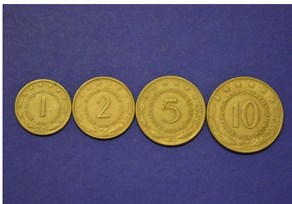
Fotografija 14 SFRJ – sprednja stran

1 dinar Država: SFRJ Leto izdaje: 1965 Material: Cu, Ni Teža: 3,8 g Premer: 21,8 mm