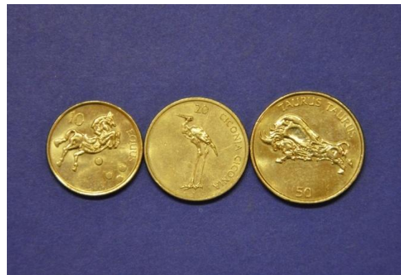
Fotografija 31 Republika Slovenija – zadnja stran