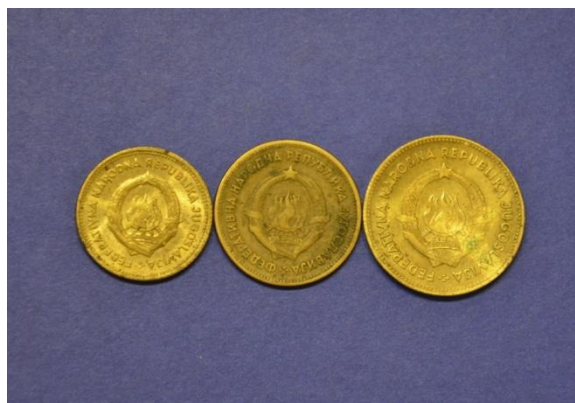
Fotografija 9 Federativna ljudska rep. Jugoslavija – zadnja stran