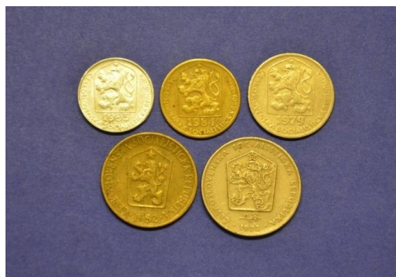
Fotografija 69 Češkoslovaška republika – zadnja stran