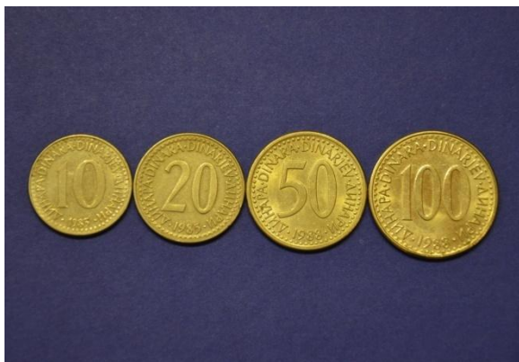
Fotografija 22 SFRJ – sprednja stran