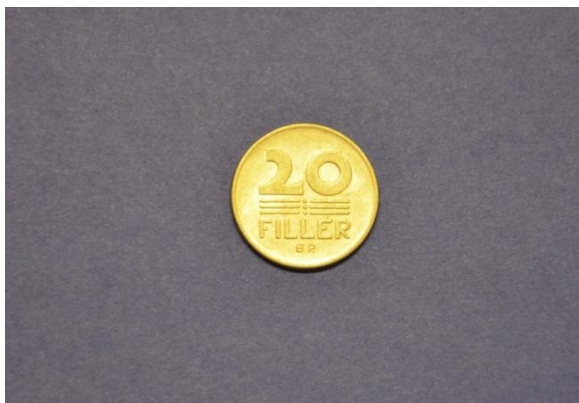
Fotografija 52 Madžarska – sprednja stran