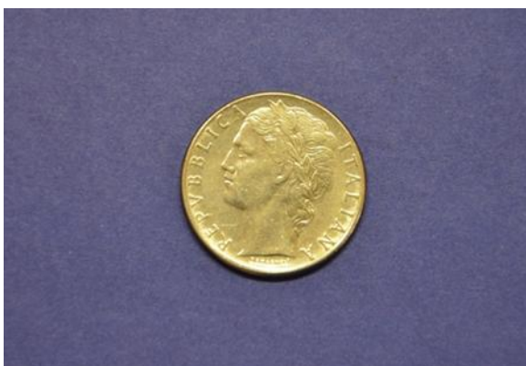
Fotografija 47 Italija – zadnja stran