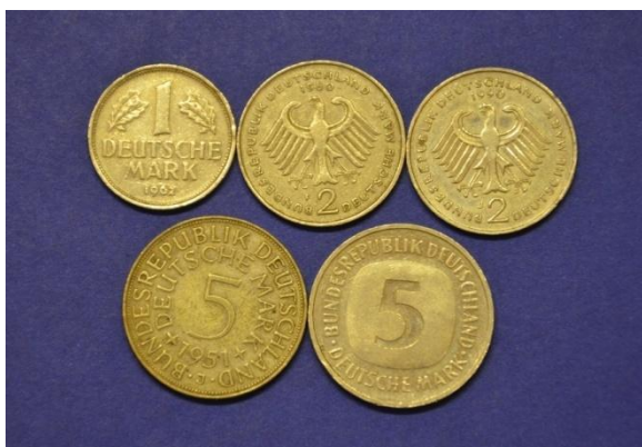
Fotografija 38 Nemška demokratična republika – sprednja stran