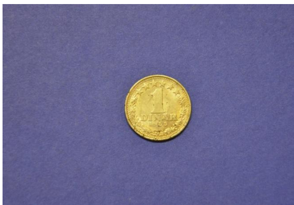
Fotografija 12 SFRJ – sprednja stran