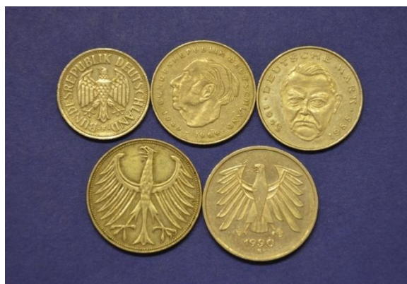
Fotografija 39 Nemška demokratična republika – zadnja stran