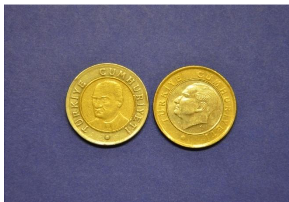
Fotografija 77 Turčija – zadnja stran