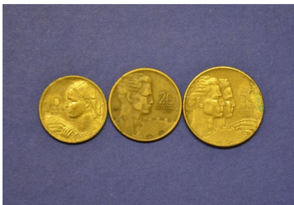
Fotografija 8 Federativna ljudska rep. Jugoslavija – sprednja stran