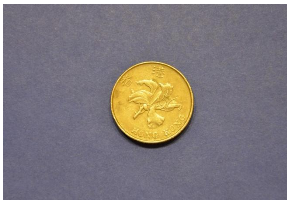
Fotografija 117 Hongkong – zadnja stran

5 dolarjev Država: Hongkong Leto izdaje: 1993 Material: Cu, Ni Teža: 13,4 g Premer: 27 mm