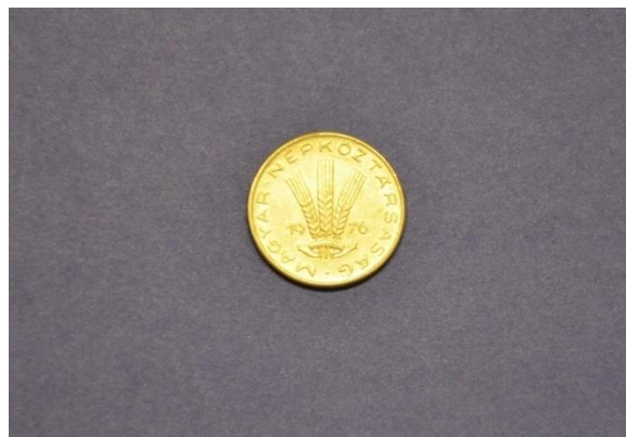
Fotografija 53 Madžarska – zadnja stran

20 fillerjev Država: Madžarska Leto izdaje: 1976 Material: Al Teža: 0,9 g Premer: 20,4 mm