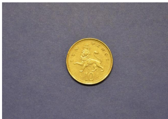
Fotografija 105 Velika Britanija – zadnja stran

10 penijev Država: Velika Britanija Leto izdaje: 1999 Material: Cu, Ni, Zn Teža: 9 g Premer: 28 mm