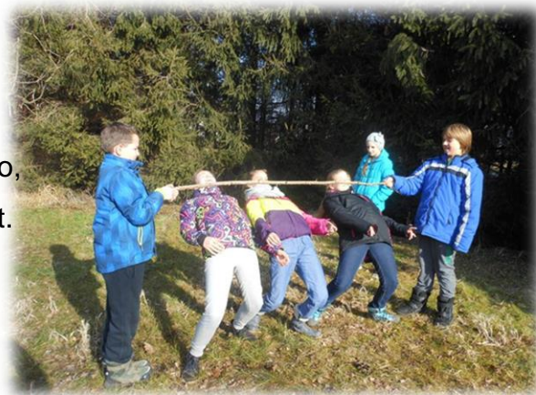
Slika 7: Gozdni limbo