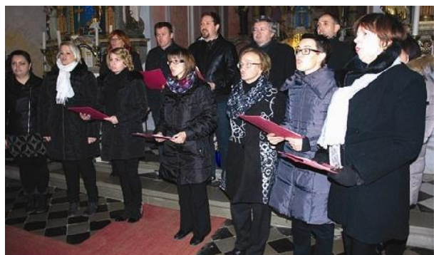
Slika 4: Mešani pevski zbor Laporje