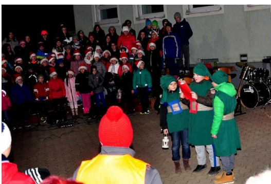
Slika 3: Šolska prireditev ob božičnem sejmu