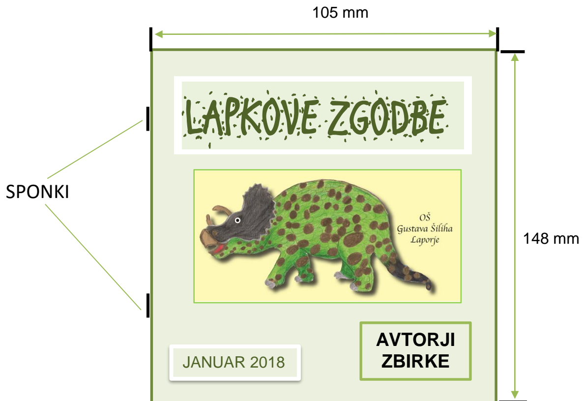
Slika 6: Oris zbirke Lapkove zgodbe

Pod naslovom bo maskota Lapka in navedeni avtorji zbirke, člani turističnega podmladka in mentorica ter datum nastanka zbirke.