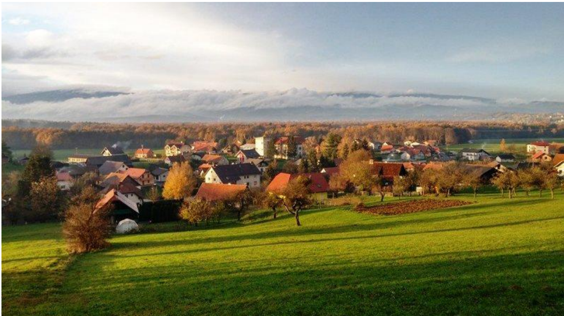
Slika 2: Pogled na Laporje (foto: M. Leskovar)

Laporje je gručasto in deloma razloženo naselje, ki leži na prehodu iz Dravinjske v Ložniško dolino. Leži na nadmorski višini 275 m. Je osrednje naselje istoimenske krajevne skupnosti, ki obsega Dolgi Vrh, Drumlažno, Hošnico, Ješovec, Kočno ob Ložnici, Križni Vrh, Levič, Razgor, Žabljek, Vrhole pri Laporju in Zgornjo Brežnico. Laporje je bogato z naravnimi in kulturnimi znamenitostmi. Ponaša se tudi z bogato zgodovino. V pisnih virih je prvič omenjeno že leta 1251 kot Lapriach. (Čas, 2008) Sredi vasi stoji osnovna šola Gustava Šiliha Laporje , ki nosi ime pedagoga Gustava Šiliha in je bila zgrajena leta 1906. Ker stari prostori niso več zadostovali za pouk, so leta 2000 dogradili prizidek, ki omogoča kvalitetno delo otrokom v vrtcu, učencem in vsem zaposlenim. Je tudi središče kulturnega in športnega življenja. (Čas, 2008) Cerkev sv. Filipa in Jakoba je osrednji kulturni spomenik v Laporju. Kot župnija je prvič omenjena leta 1395. Na južni strani cerkve je vzidan žrtvenik, posvečen rimskemu bogu Marsu. Notranja oprema cerkve je bogata. Glavni oltar je delo Jožefa Holzingerja, več ostalih kipov pa je delo Jožefa Strauba. Sedanjo cerkev iz leta 1374 so prezidali leta 1907. (Čas, 2008)