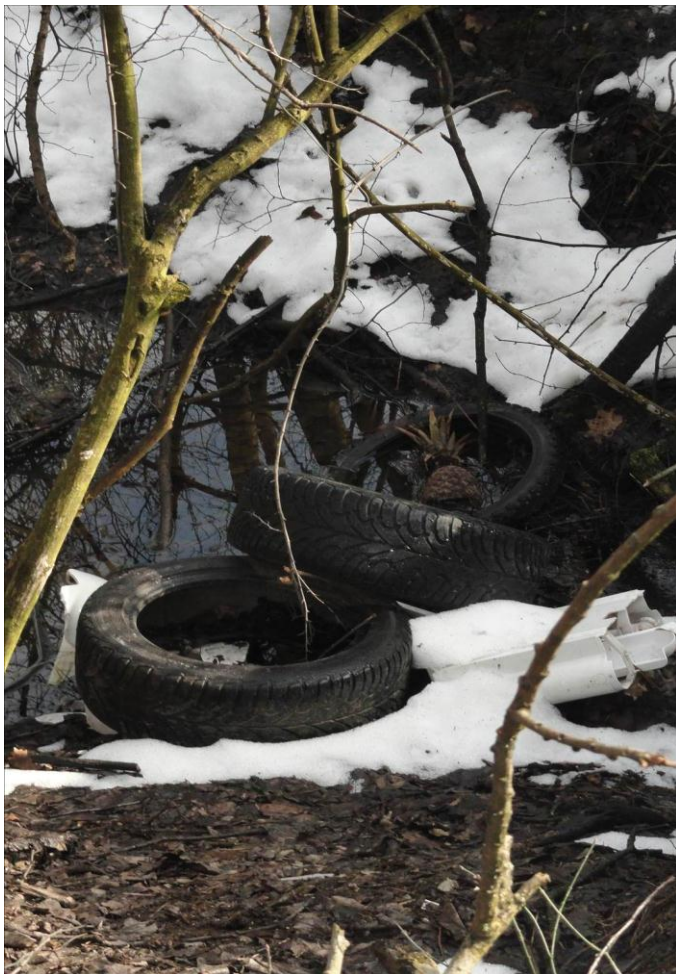
Slika 1: Zаметki odlagališča št. 3