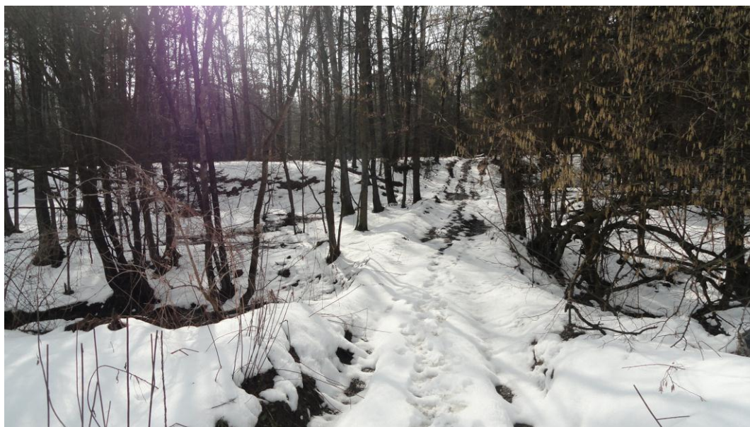
Slika 2: Lokacija divjega odlagališča iz registra divjih odlagališč št. 4

Karta 2 prikazuje izrez slike iz Registra divjih odlagališč. Prikazuje, koliko divjih odlagališč je v KS Laporje. V akciji Očistimo Slovenijo v enem dnevu v KS Laporje niso bila odstranjena vsa divja odlagališča. V KS Laporje je nekaj divjih odlagališč z nevarnimi odpadki in nekaj navadnih divjih odlagališč. Na podlagi registra o divjih odlagališčih so divja odlagališča se predvsem nahajajo v gozdovih in ob prometnicah. Iz karte 2 je razvidno, da so nekatera divja odlagališča zgoščena, druga pa so bolj »osamljena« od ostalih. Seveda je namen najine naloge opozoriti na ta pojav, o tem obvestiti KS Laporje ter čim bolj zmanjšati število divjih odlagališč v KS Laporje oz. jih trajno odpraviti. Stanje na terenu kaže, da se divja odlagališča ne pojavljajo, kar kaže na pozitiven učinek ekoloških akcij Očistimo Slovenijo v enem dnevu (2010) in Očistimo Zemljo v enem dnevu (2012).