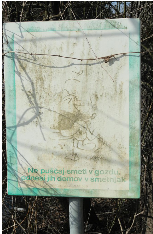
Slika 4: Opozorilne table