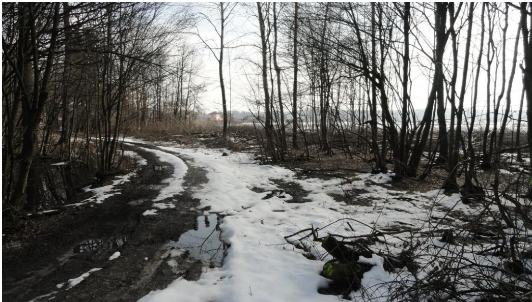
Slika 3: Mesto divjega odlagališča pri železniški postaji Slovenska Bistrica

Terensko delo sva izvedli tako, da sva obiskali divja odlagališča, ki so prikazana v tabeli 1 in karti 2.